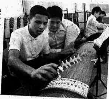
ポンティアック市から来た中学生(左)と一緒に箏を弾く生徒たち(草津市立松原中学校)

雲の合間に秋の青空がのぞいた25日午後、草津市下笠町の市立松原中学校では、米・ミネソタ州のポンティアック市から来た中学生3人が、箏の演奏に挑んでいた。音楽の授業で、曲は「さわら」。ポンティアック市と草津市は1978年に姉妹都市になった。交流が途絶えた時期もあったが、今年は現地の中学