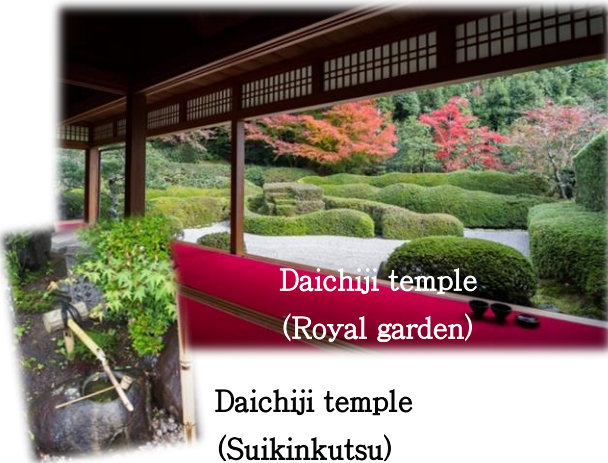
Daichiji temple (Royal garden)